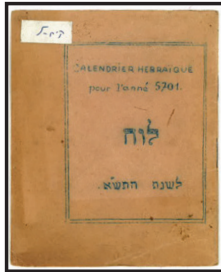
שער לוח השנה לשנת התש"א (ראה בעמוד הבא)

הרבי אסר על אחרים לצום ולהתענות אך מצעירותו הרבה לצום כמעט ימים שלימים • הקפיד על תענית בה"ב שאחרי החגים וגם בימים שאחרי התקף הלב בשנת תשל"ח • מה באמת ההבדל בין הרבי והחסידים? • מדוע נאסר על חסידים להחמיר כמו הרבי