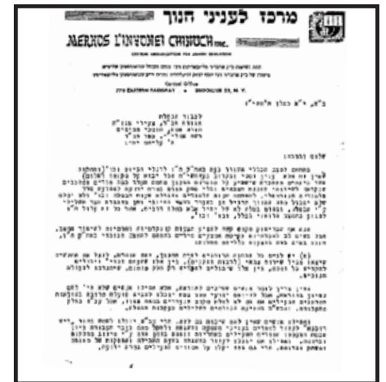
מכתב המזכירות' (בשני חלקים) בפירסום ראשון

לכבוד צעירי אגודת חב"ד באה"ק ת"ו ה' עליהם יחיו - מכתב ובו שני נושאים שונים, ובסיומו (כאן בפירסום ראשון):