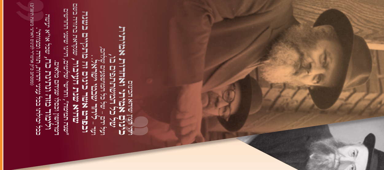
ככל יכולתו ככל עניני יחודות, תורה ומצוות, "מפנים ל"ש ארבע" לכינוס תאביש ישיבת תשע"ח

ניגוני שמחה והתועודות עם שמחה פרידמו בליווי מקהלה מחסידי חב"ד