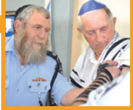
לעולם לא מאוחר מדי. אדלשטיין חוגג עם הרב