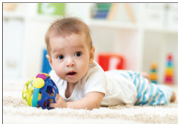
לראות בילודה ערך, להעצים את המשפחות ברוכות הילדים

אם הסכנה הדמוגרפית מטרידה את יוזמי הקמפיין, למה אינם חושבים על פתרונות בכיוון החיובי – הגדלת מספר היהודים?