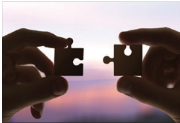
משני חלקי הפאזל נוצרת שלמות אחת

בורא העולם ברא את הגבר שונה מהאישה. זה כל היופי בחתונה, שבה מתחברות יחדיו תכונותיו של הגבר עם סגולותיה של האישה