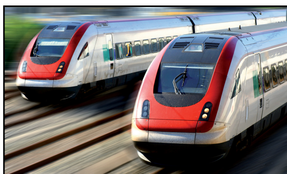
השאלה הגדולה: חיים זה לצד זה או עלייה על נתיב התנגשות

מישהו העלה את כל הרכבות הצודקות האלה על מסלול התנגשות, ועכשיו הן דוהרות במלוא הקיטור אל ההתרסקות הבלתי נמנעת.