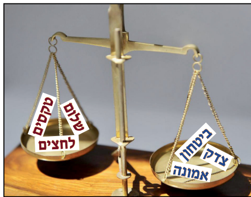
בלום עכשיו ולא לתלות תקוות במשאל עם עתידי

תפקידו של קברניט לנווט את הספינה הרחק מן השרטון המסוכן, ולא להניח לתהליכים הריאסון להבשיל וליהפך לדבר מוגמר