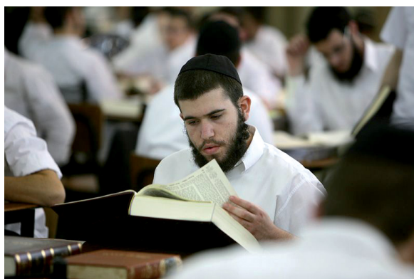
תלמידי הישיבות נושאים בעול חשוב וחיוני

בורות ובוז כלפי הזולת אינם כלים שמאפשרים להצמיח פתרונות נכונים ואמיתיים, אלא רק מעמיקים את התהום