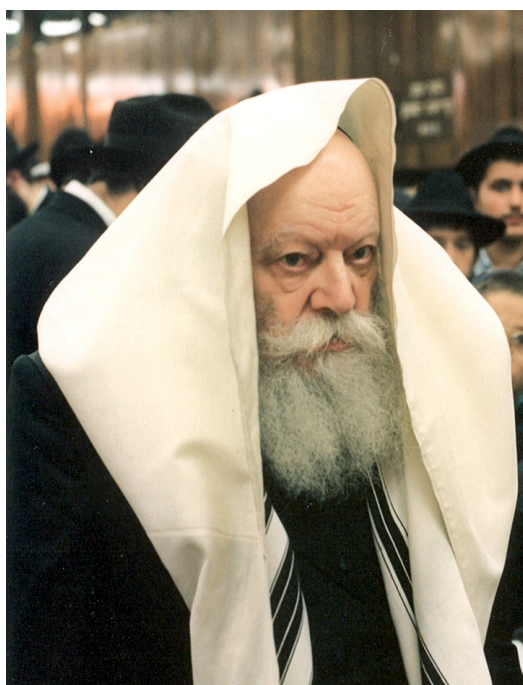
הרבי מליובאוויטש. התמסרות ללא שיור למען עם ישראל

הרבי מליובאוויטש הוא קרון האור ששתל הקב"ה דווקא בדור היתום והמוכה שלנו, דור רב תהפוכות, מבוכות ולבטים