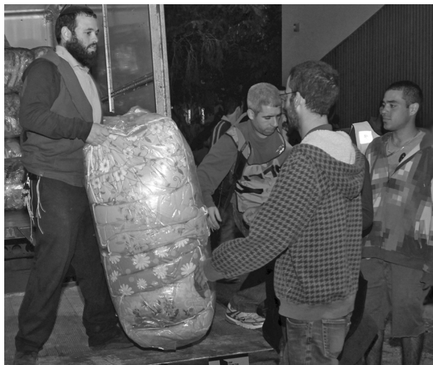
מתנדבים בחלוקת שמיכות לנזקקים. צילם: שמואליק סופר

לא דיי לקיים את מצוות הצדקה והחסד משום שזו מצווה. הקיום השלם של המצווה הוא כשהאדם חש אכפתיות לזולת ודאגה אמיתית לשלומה